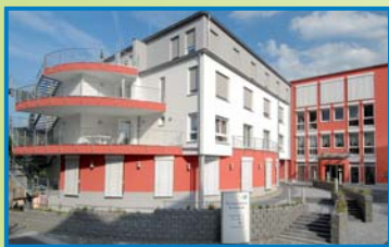
SENIORENZENTRUM ST. ELISABETH Hofstraße 7 53557 Bad Honningen