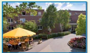
ALTEN- UND PFLEGEHEIM ST. JOSEF Josefshausstraße 8 56428 Dernbach