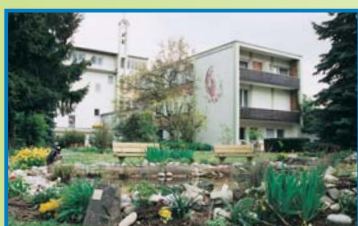
ALTEN- UND PFLEGEHEIM ST. JOSEF Emser Straße 392 56076 Koblenz-Horchheim