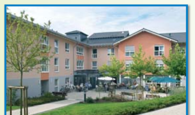
ALTEN- UND PFLEGEHEIM ST. SUITBERTUS Grabenstraße 43 56598 Rheinbrohl