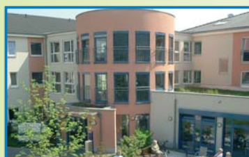
SENIORENZENTRUM ST. PETER Andernacher Straße 4 56218 Mülheim-Kärlich