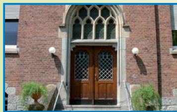
HERZ-JESU-HEIM Rheinstraße 9 56428 Dernbach