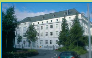
ALTEN- UND PFLEGEHEIM ST. BARBARA Waisenhausstraße 8 56073 Koblenz