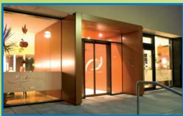
KATHARINA-KASPER-SENIORENZENTRUM Am Stadtgraben 33-35 56626 Andernach

Mit freundlicher Unterstützung der Buchhandlung am Rathaus Montabaur